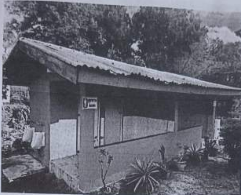
ภาพหลังการดำเนินการปรับปรุงซ่อมแซมห้องน้ำ